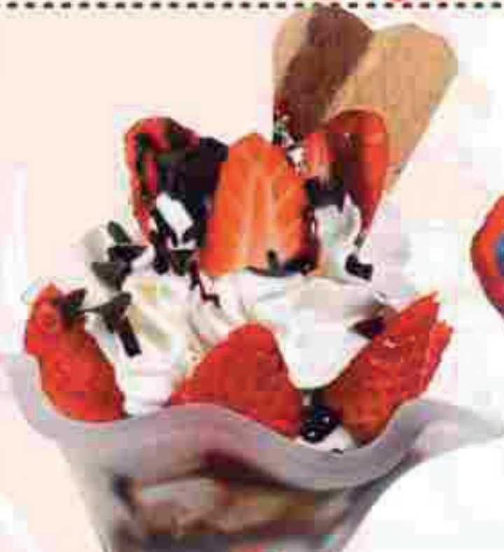
668. Erdbeer Schoko

Vanille-Eis, Schokolade, frische Erdbeeren und Sahne