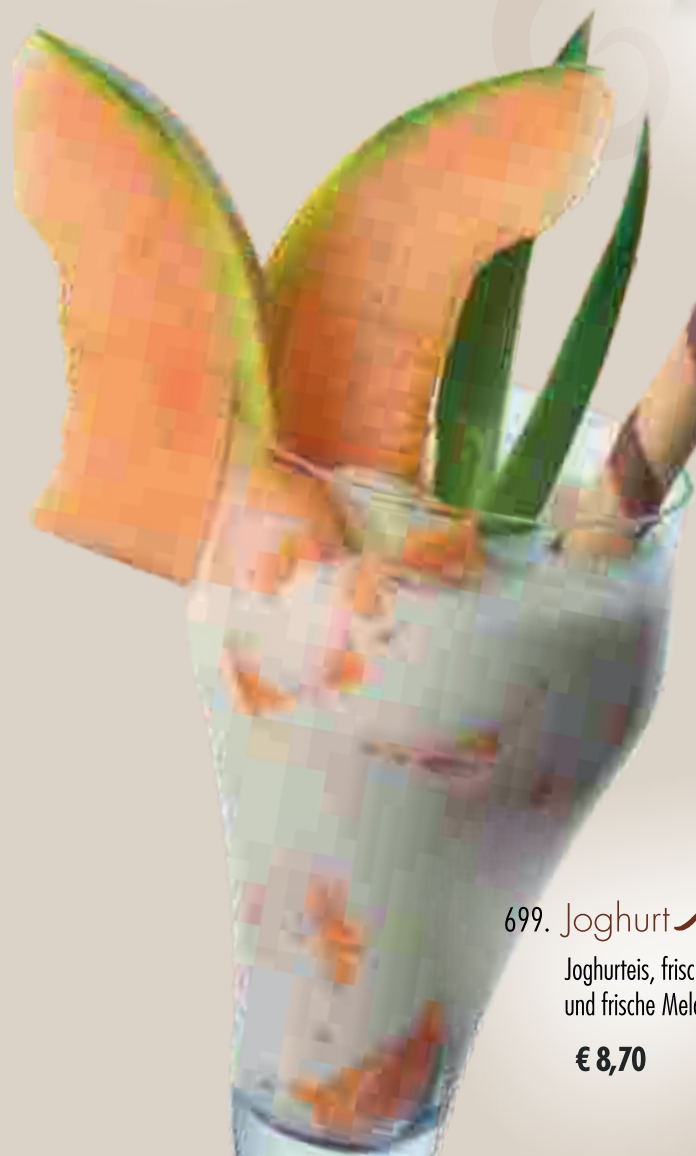
699. Joghurt Melone 1 Joghurteis, frischer Joghurt und frische Melone € 8,70