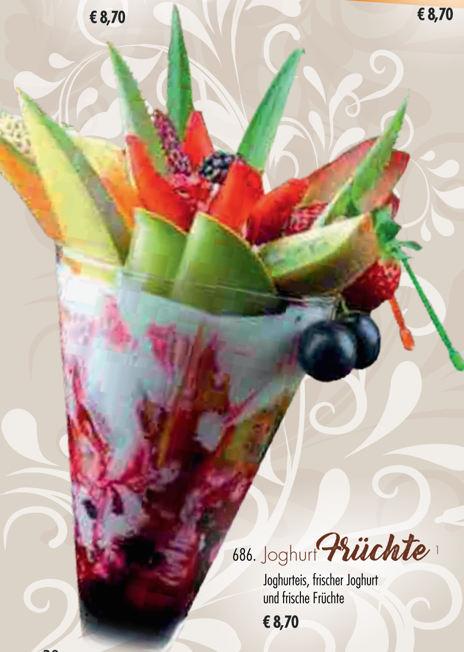
686. Joghurt Früchte 1

Joghurteis, frischer Joghurt und frische Früchte