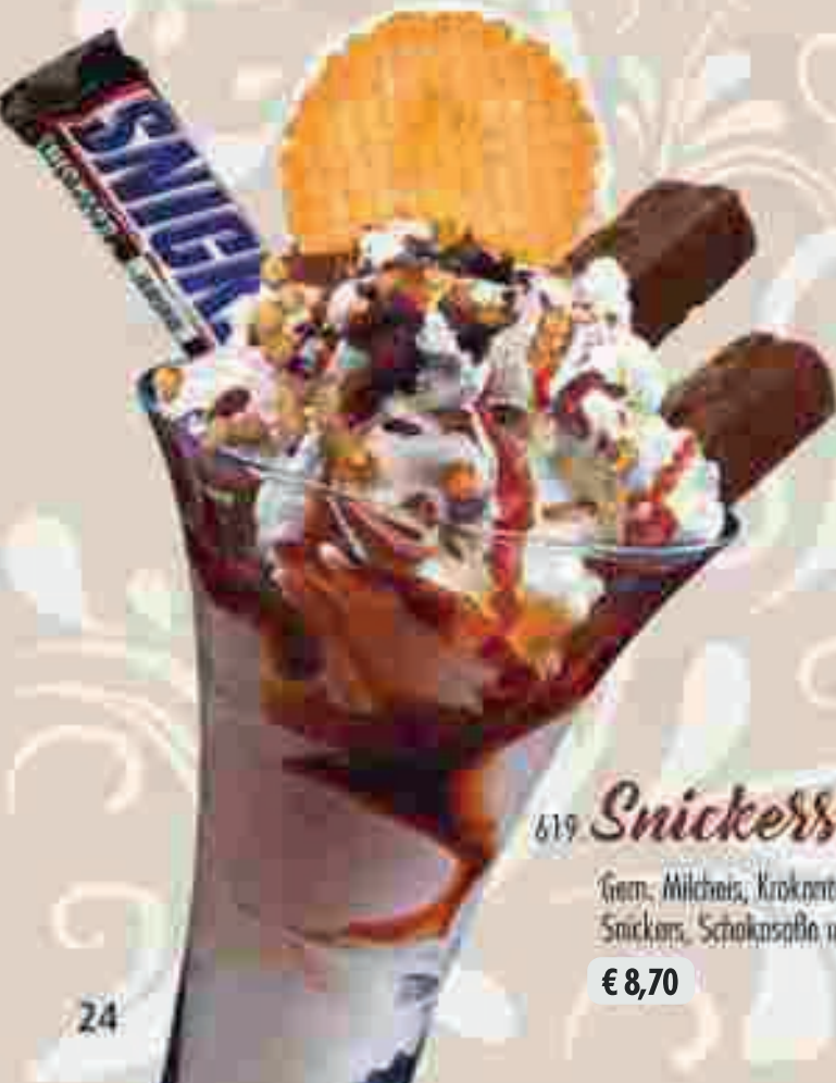
619 Snickers Becher Gem. Milchis, Krokantausel, Snickers, Schokosofie und Sahne € 8,70