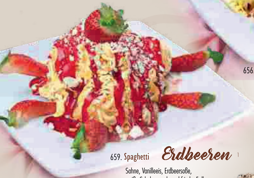
659. Spaghetti Erdbeeren 1

Sahne, Vanilleeis, Erdbeersofe, weiße Schokoraspeln und frische Erdbeeren