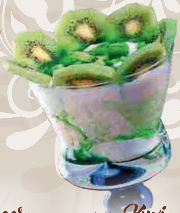
689. Joghurt Kiwi 1 Joghurteis, frischer Joghurt und frische Kiwi € 8,70