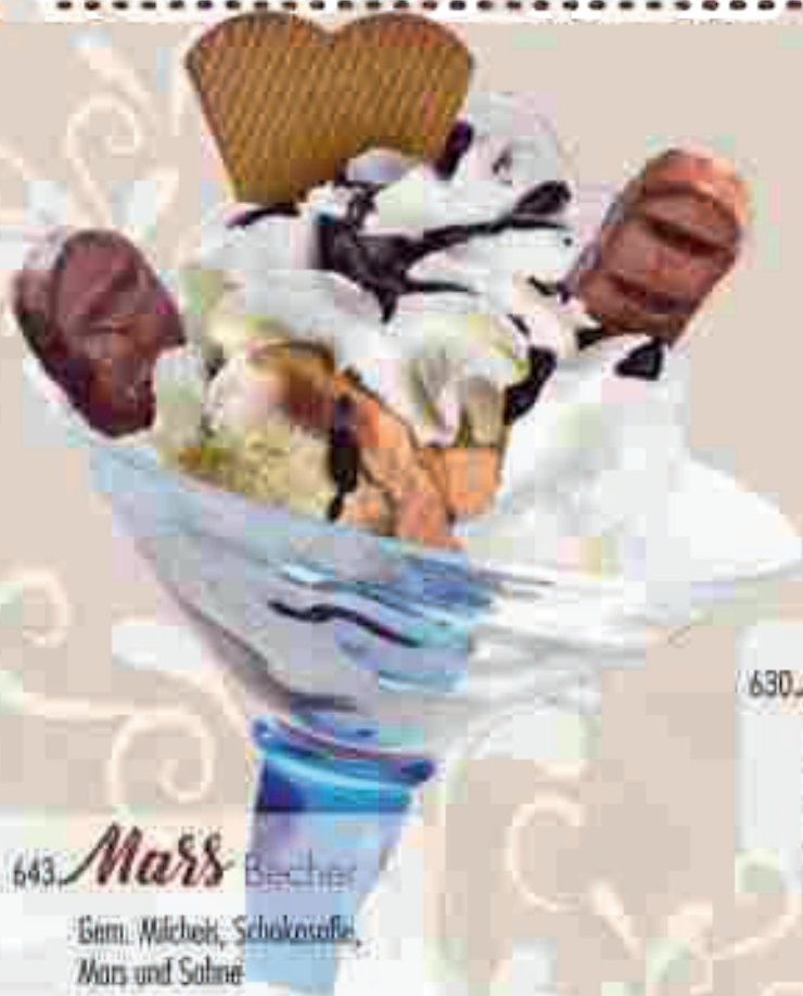
643 Mars Becher Gem. Milchis, Schokosofie, Mars und Sahne € 8,70