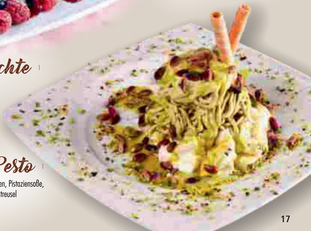
661. Spaghetti Pesto 1

Pistazieneis, Pistazien, Pistaziensoße, Sahne und Krokantstreusel