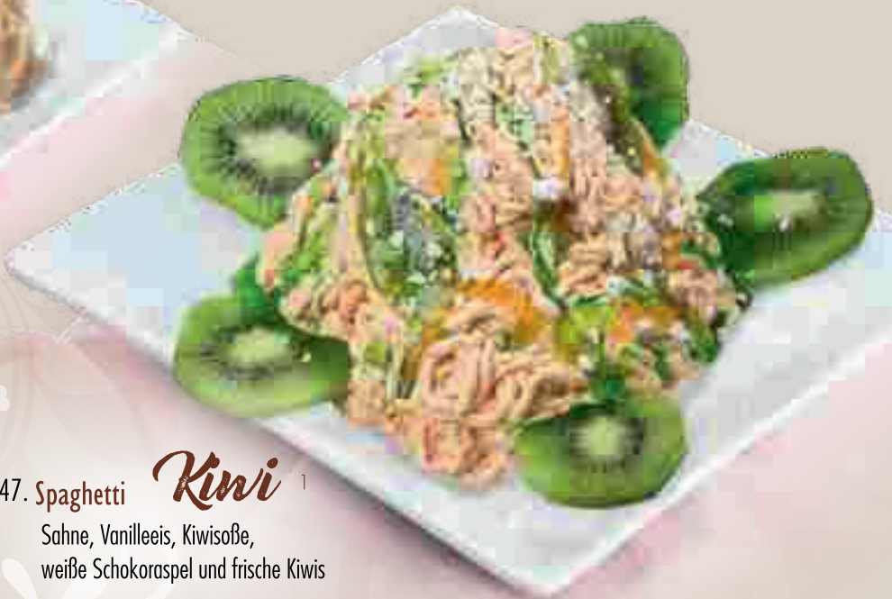
647. Spaghetti Kiwi 1 Sahne, Vanilleeis, Kiwisoße, weiße Schokoraspel und frische Kiwis € 7,70