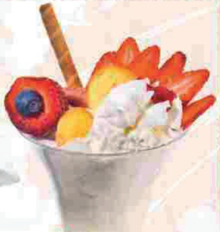
681. Erdbeer Prosecco

Zitroneneis, Prosecco und frische Erdbeeren