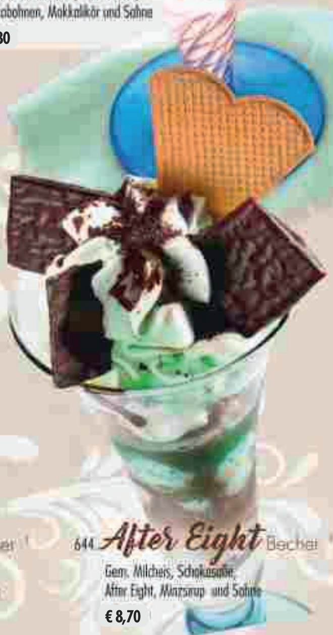
644 After Eight Becher Gem. Milchis, Schokosofie, After Eight, Marsrup und Sahne € 8,70