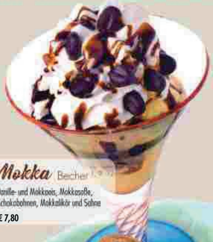
630 Mokka Becher Vanille- und Mokkaeis, Mokka-Soße, Schokabohnen, Mokkalikör und Sahne € 7,80