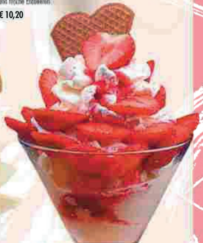
673. Erdbeer Becher

Vanilleeis, Erdbeersauce, frische Erdbeeren und Sahne