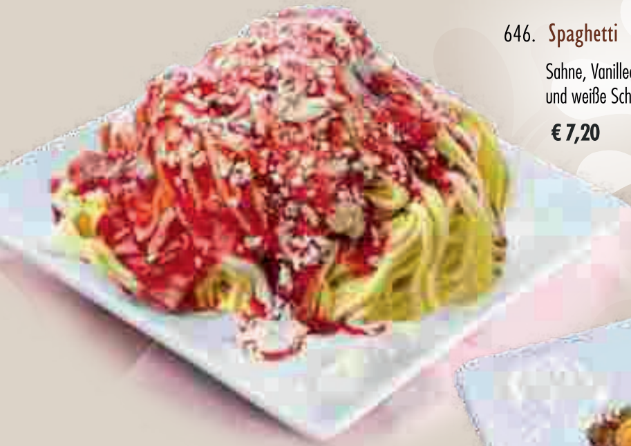
646. Spaghetti Eis 1

Sahne, Vanilleeis, Erdbeersofe und weiße Schokoraspel