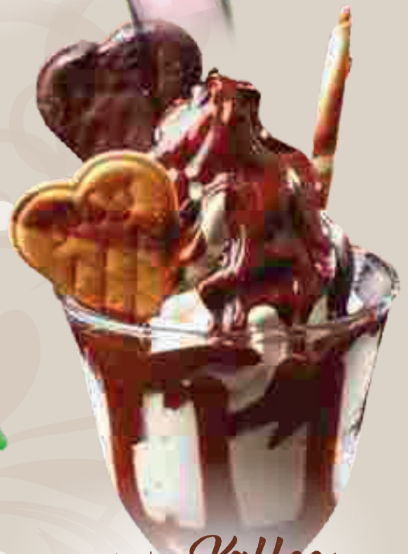
696. Joghurt Kaffee 1

Joghurteis, frischer Joghurt, kalter Kaffee und Schokosoße