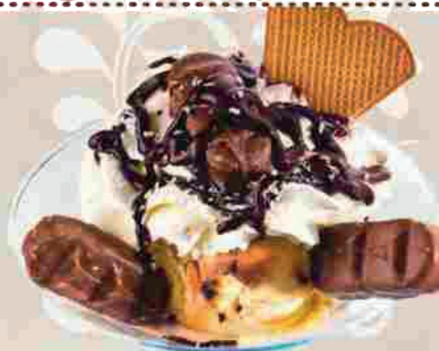
645 Bounty Becher //

Gem. Milchis, Kokosraspeln, Bounty Praline, Schokosaße und Sahne