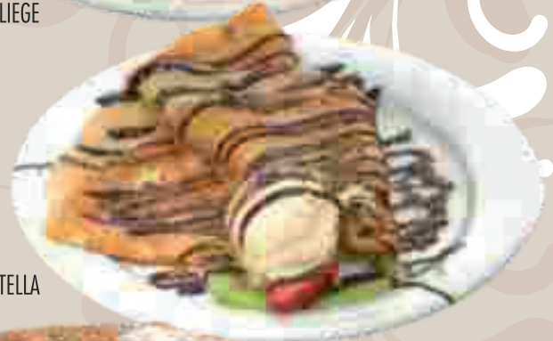
CRÊPE ALLA NUTELLA