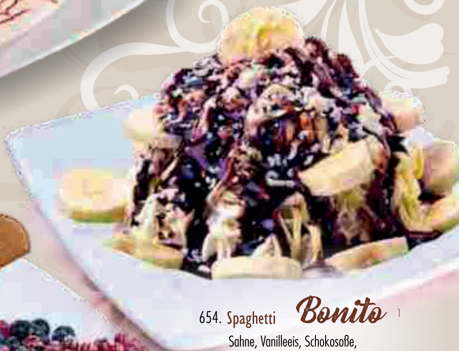
654. Spaghetti Bonito 1

Sahne, Vanilleeis, Schokosoße, weiße Schokorasel und Bananenscheiben