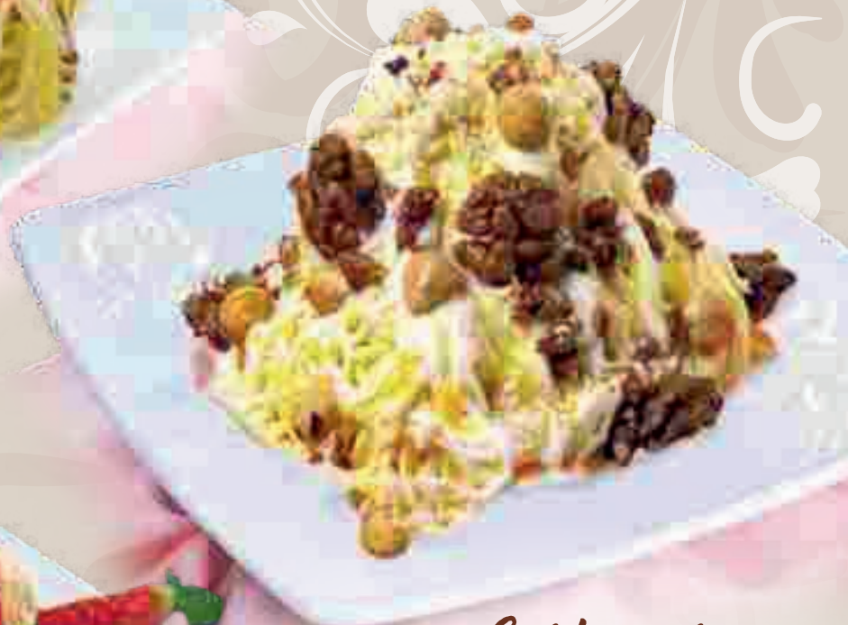
656. Spaghetti Carbonara 1,12

Sahne, Vanilleeis, Eierlikör, Krokantstreusel und versch. Nüsse