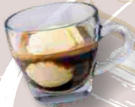
Affogato € 4,60 Espresso mit einer Kugel Eis