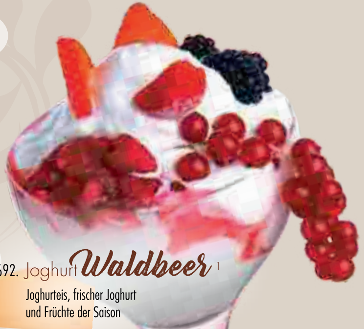
692. Joghurt Waldbeer 1

Joghurteis, frischer Joghurt und Früchte der Saison