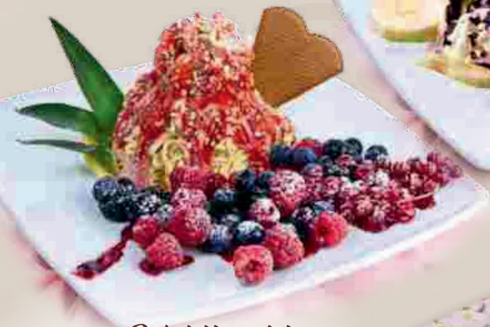
658. Spaghetti Waldfrüchte 1

Sahne, Vanilleeis, frische Erdbeersöße, weiße Schokorasel und Waldfrüchte