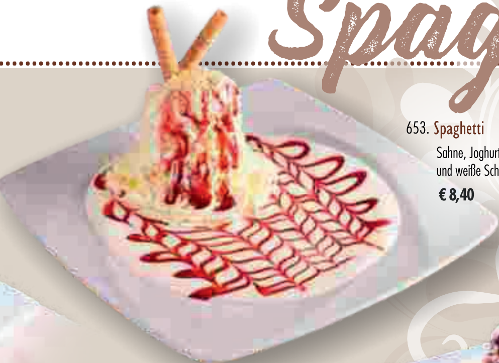
653. Spaghetti Yoghurt 1

Sahne, Joghurteis, frischer Joghurt und weiße Schokoraseln