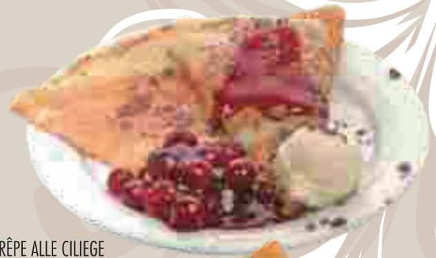
CRÊPE ALLE CILIEGE