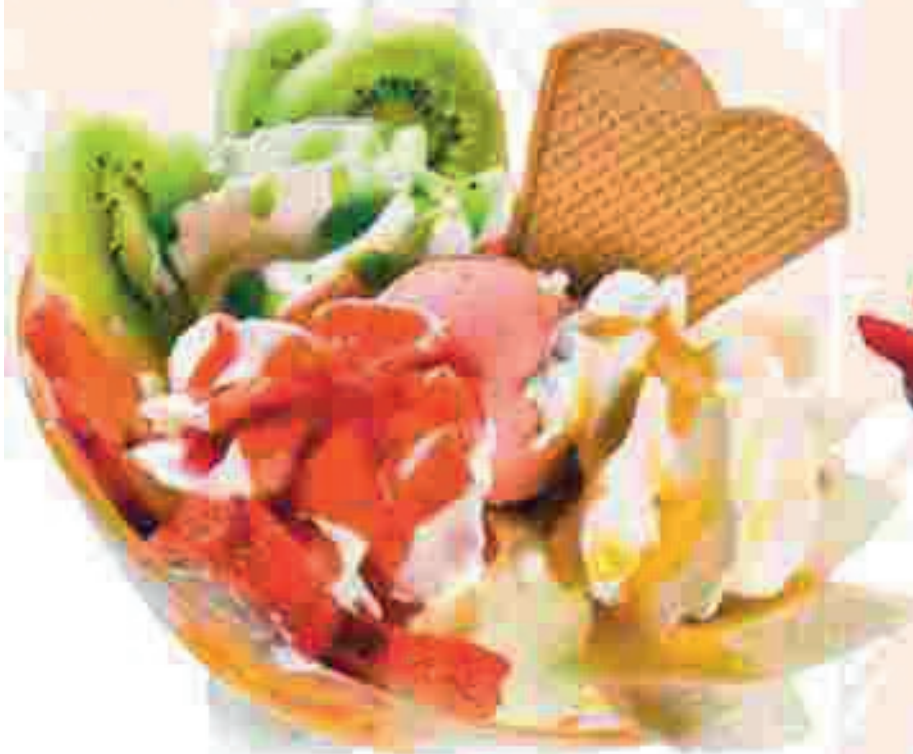
666. Erdbeer Italia

Vanille- und Erdbeereis, Erdbeersauce, frische Erdbeeren, Kiwi und Banane, Sahne