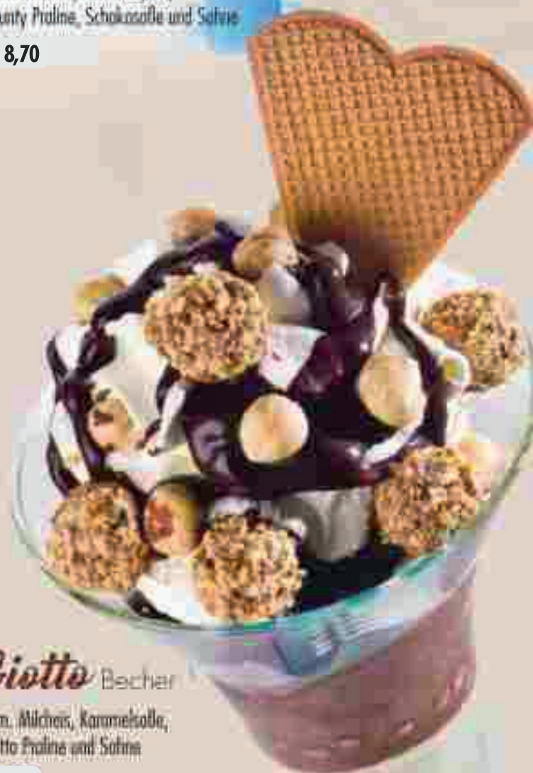
640 Giotto Becher //

Gem. Milchis, Karamelsaße, Giotto Praline und Sahne