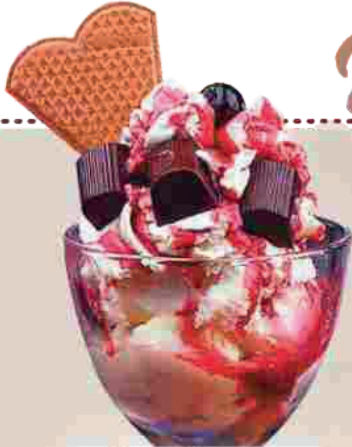
641 Mon Cheri Becher //

Gem. Milchis, Amarenokirschen, Schokosaße, Mon Cheri Praline und Sahne