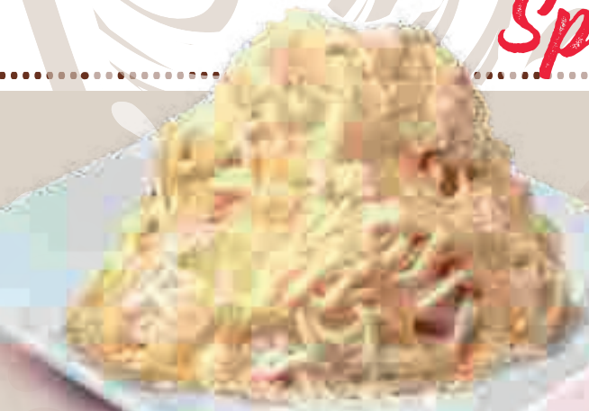
655. Spaghetti Vanille 1 Sahne, Vanilleeis, Vanillesoße und weiße Schokoraspel € 7,40