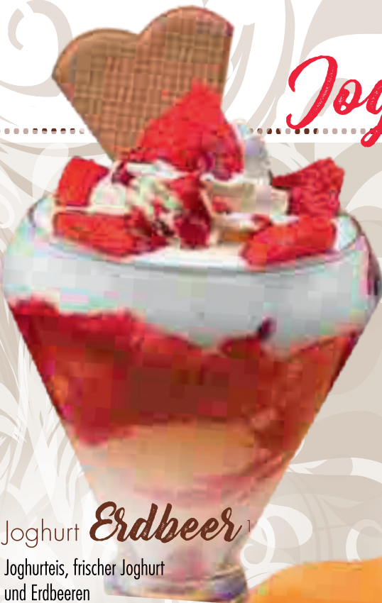
684. Joghurt Erdbeer 1

Joghurteis, frischer Joghurt und Erdbeeren