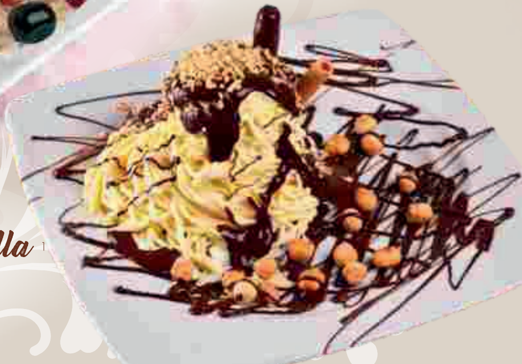
650. Spaghetti Nutella 1 Vanilleeis, Nutella, Nüssen, Sahne und Krokantstreusel € 8,40