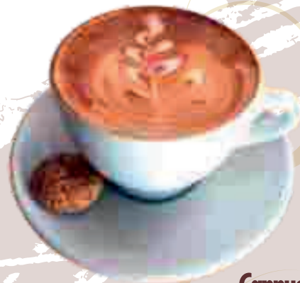
Cappuccino € 3,80