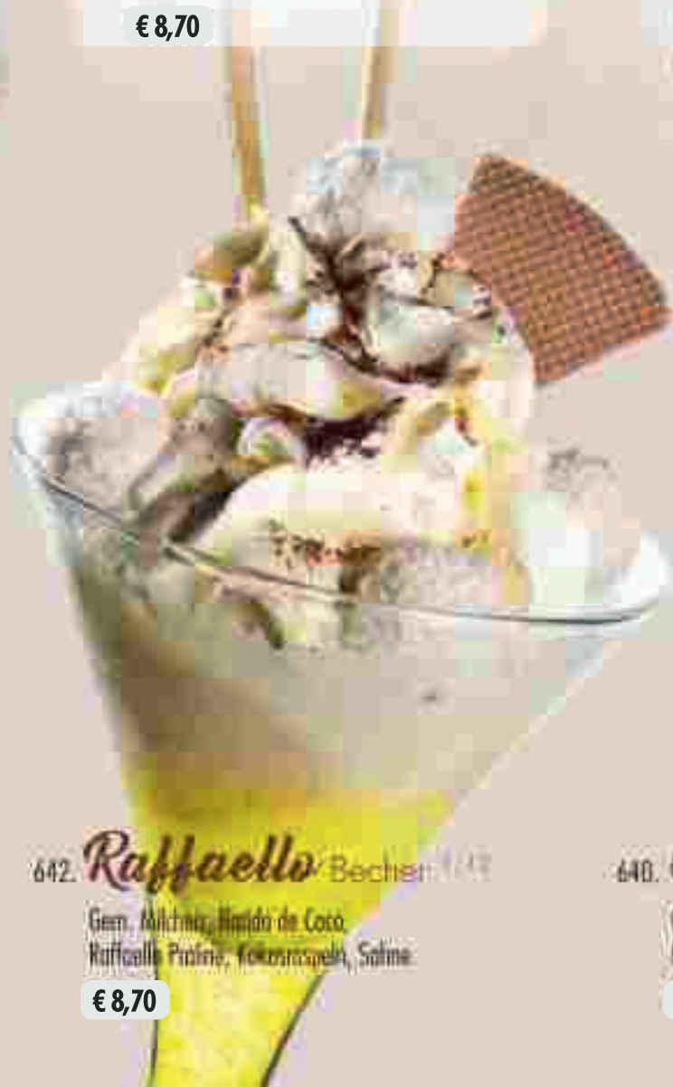
642 Raffaello Becher //

Gem. Milchis, Haard de Coco, Raffaello Praline, Kokosraspeln, Sahne