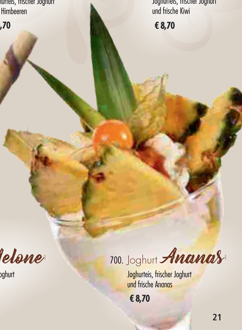
700. Joghurt Ananas 1 Joghurteis, frischer Joghurt und frische Ananas € 8,70