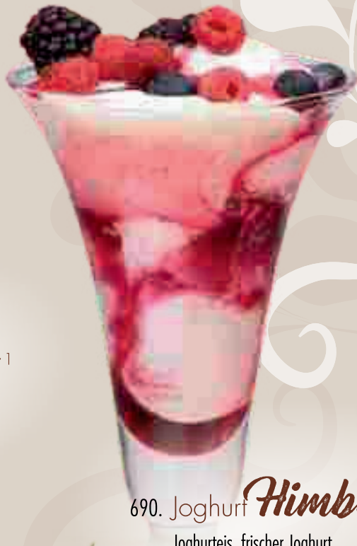
685. Joghurt Fitness 1 Joghurteis, frischer Joghurt, Müsli und Honig € 8,70